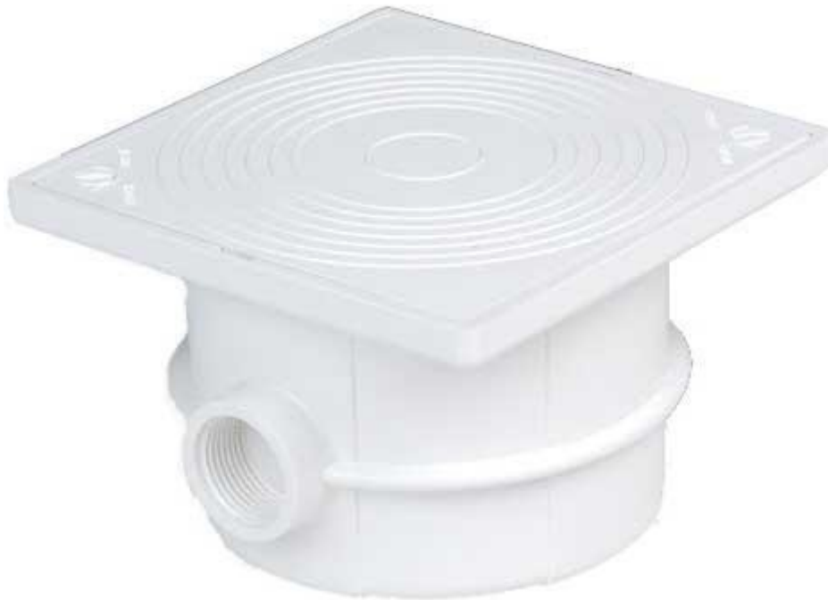
Scatola derivazione / sicurezza fari piscina

Il fissaggio della scatola di derivazione, verrà eseguito ad opera dei piastrellisti, durante la posa del rivestimento finale del marciapiede.